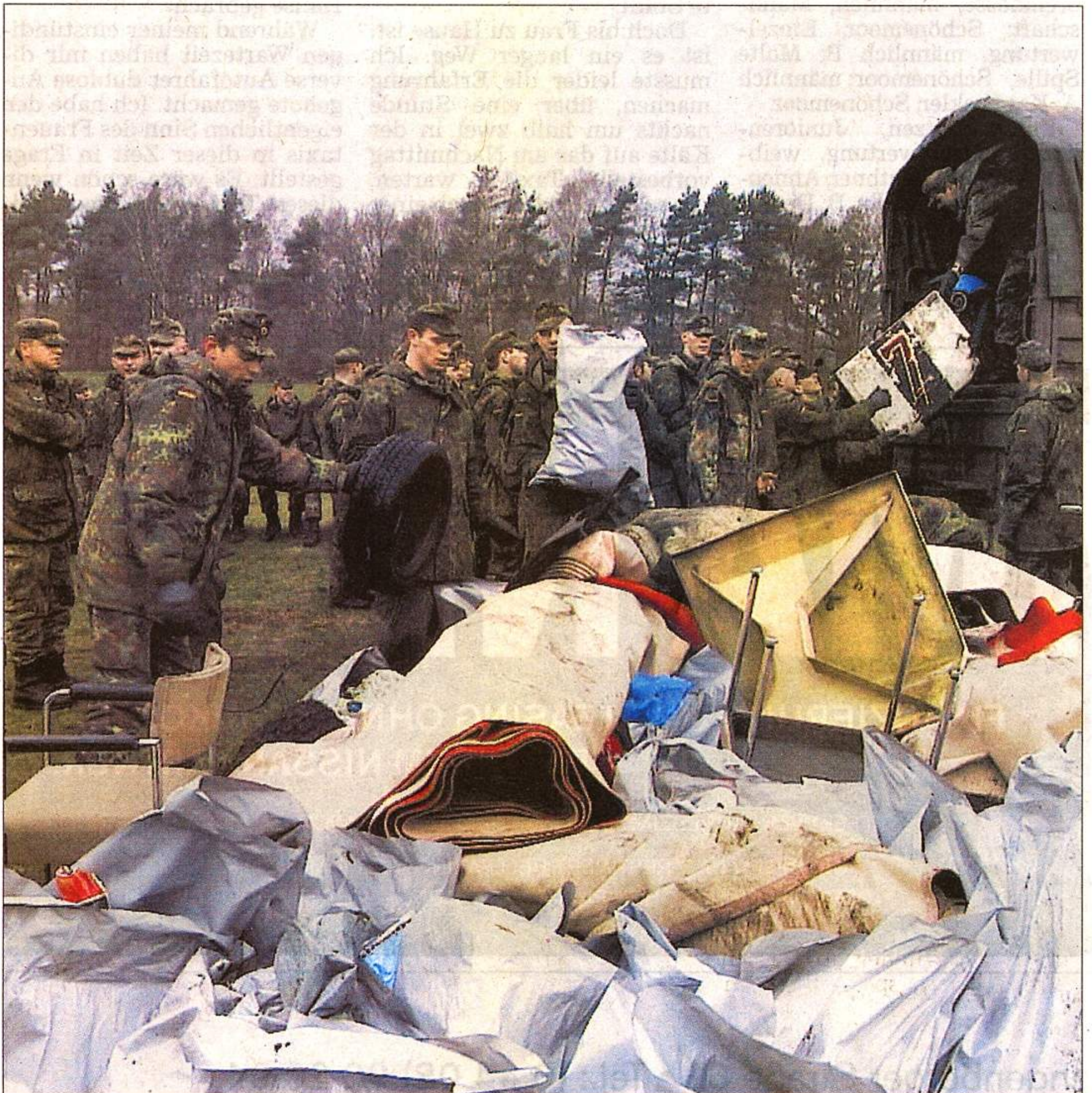
Haufenweise Tische, Teppiche und Stühle fanden die Soldaten auf der Großen Höhe.