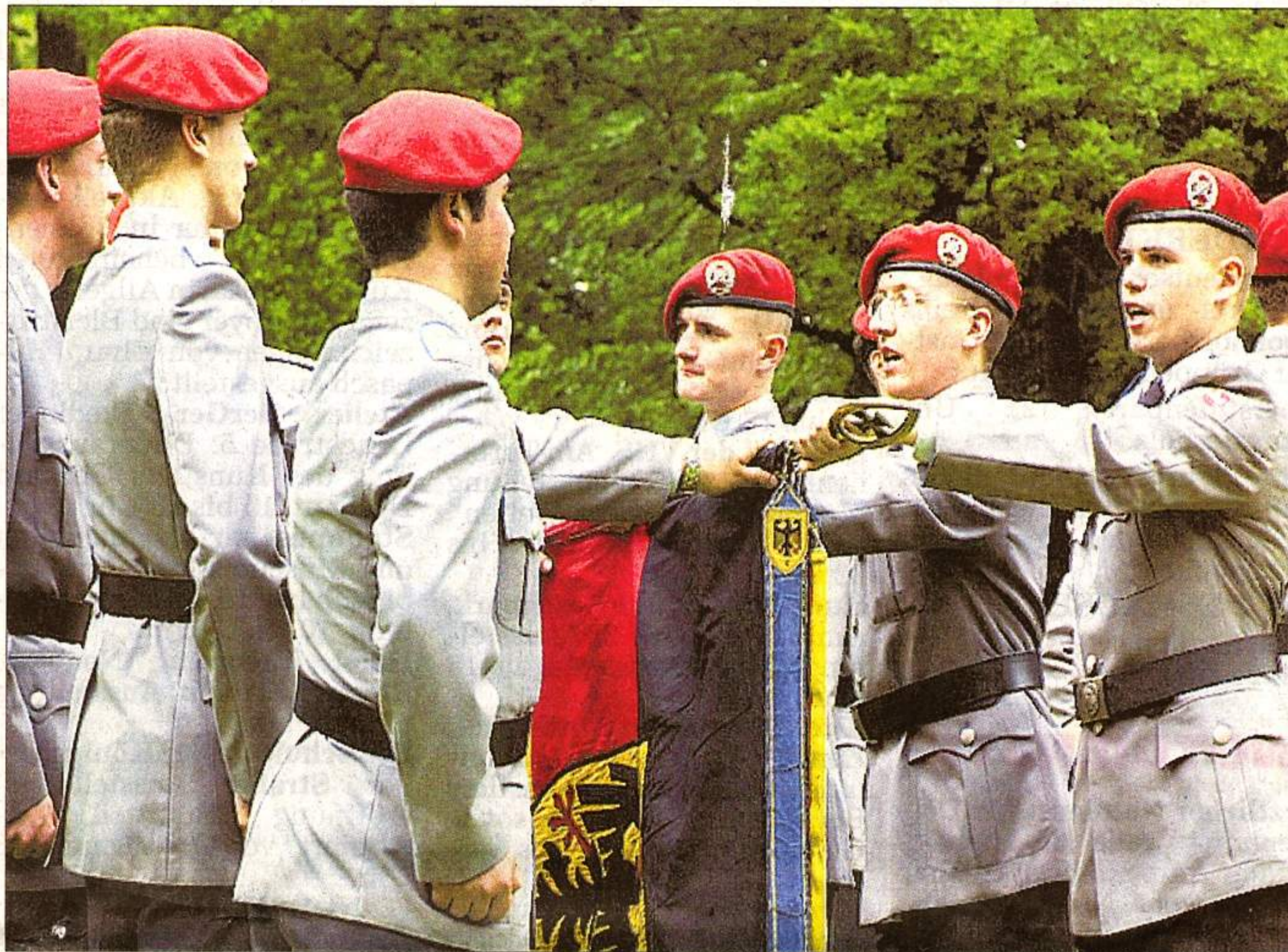
Rekruten beim Treuegelöbnis auf die Fahne und den Staat.

Cohrs sagte, abseits der alten Konflikte gebe es neue Bedrohungen und Angriffe, die weltweit den Einsatz deutscher Soldaten zur Friedenssicherung herausforderten, unter anderem auf dem Balkan oder in Afghanistan. Cohrs: „Die Wehrpflicht war und ist für die Bundesrepublik ein Erfolgsmodell.“ Schwettmann betonte, in Deutschland habe