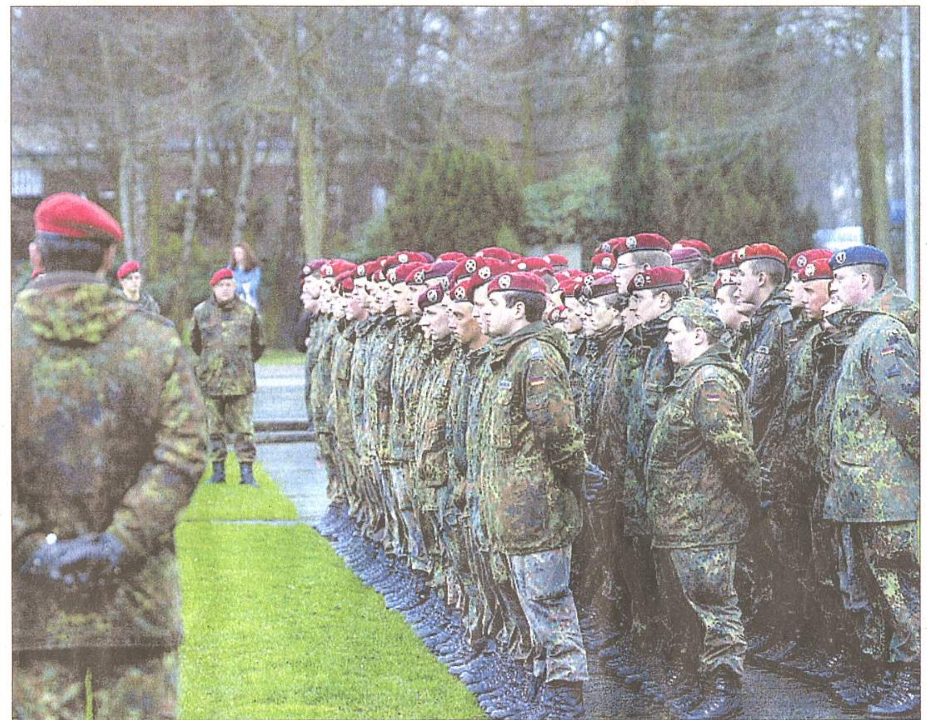
„Gefahr von subversiven Elementen“: Die Soldaten müssen bei ihrem Afghanistan-Einsatz mit einigen Risiken rechnen.