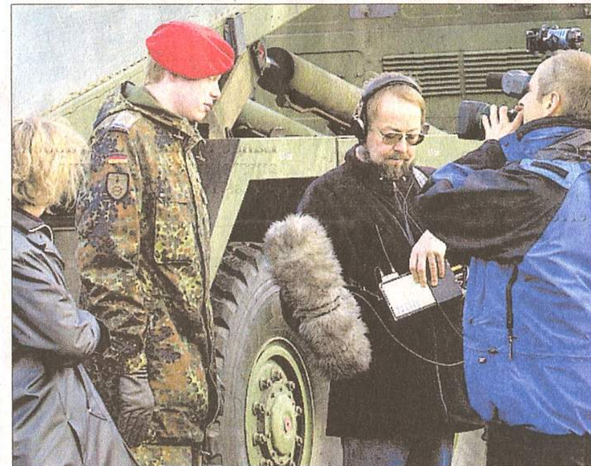
Im Blickpunkt der Medien: Auch Fernsehsender nutzten den Appell zu Gesprächen mit den Soldaten der Afghanistan-Kompanie.