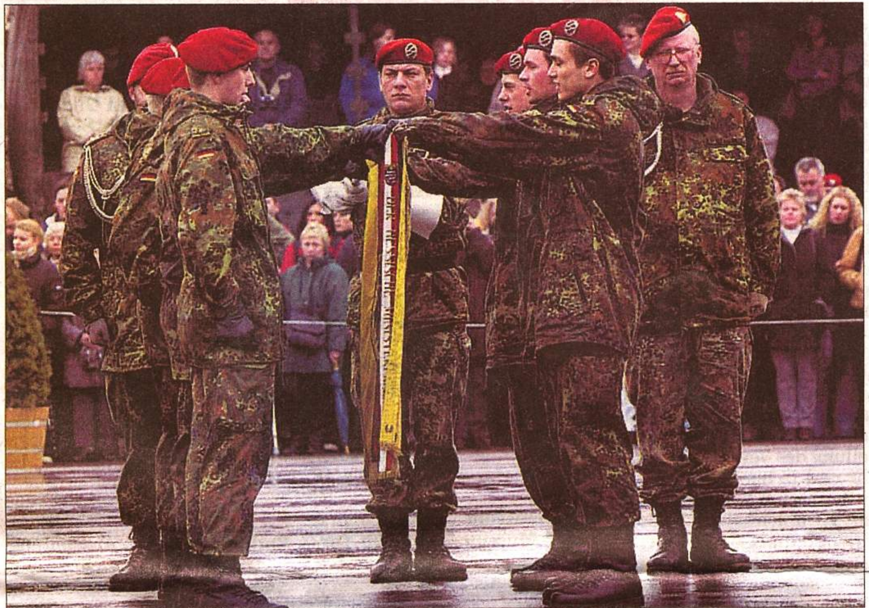
Neue Bundeswehrosoldaten in Adelheide: Zahlreiche Angehörige und Freunde wohnten gestern dem feierlichen Gelöbnis der jungen Rekruten bei.

ständlichkeit. Nur einsatzbereite Sicherheitskräfte könnten den Bürgern ein Leben in Frieden und Freiheit gewährleisten.