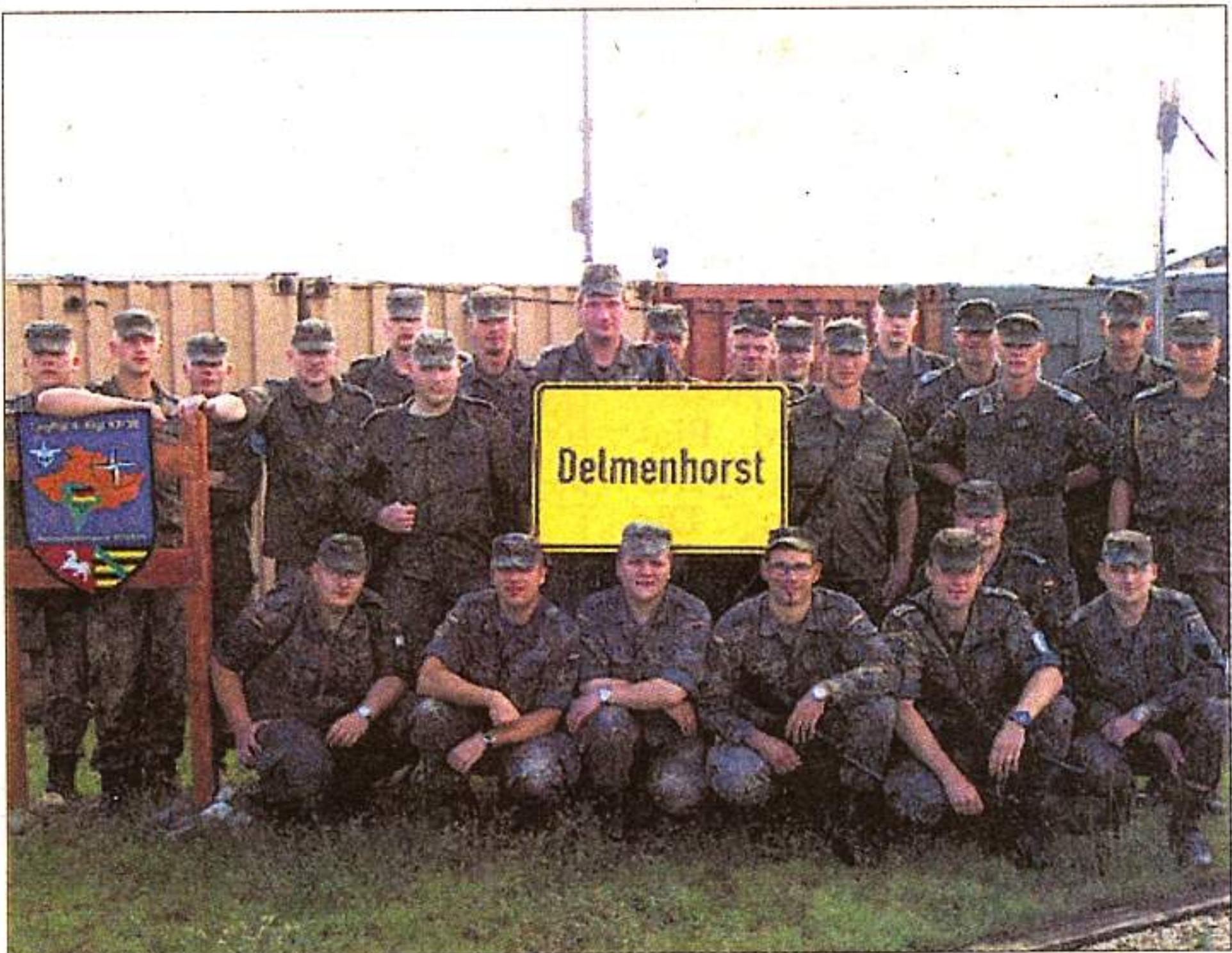
Ein Ortsschild als Verbindung zur Heimat. In Kürze kehren die Soldaten aus dem Kosovo zurück.