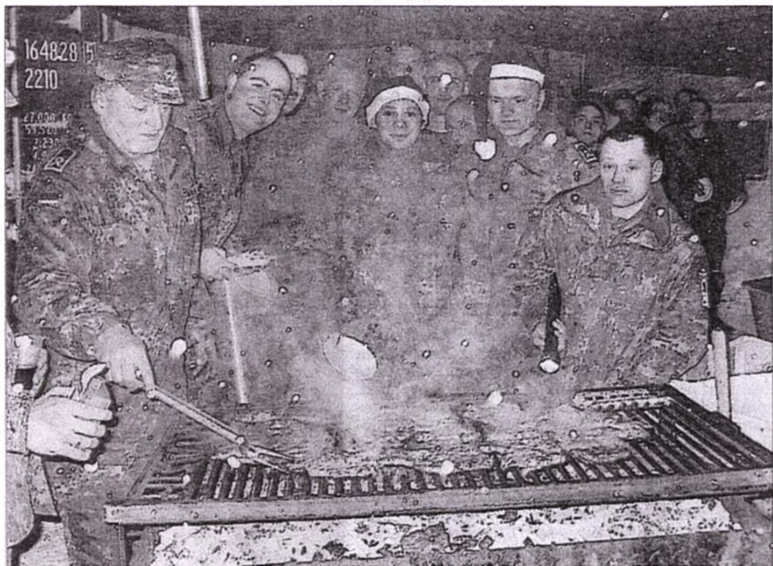
Nur kurzfristig brachte eine spontane Grillfeier am Heiligabend Ablenkung von den Gedanken an die Familien daheim: Delmenhorster Soldaten im Kosovo-Feldlager.