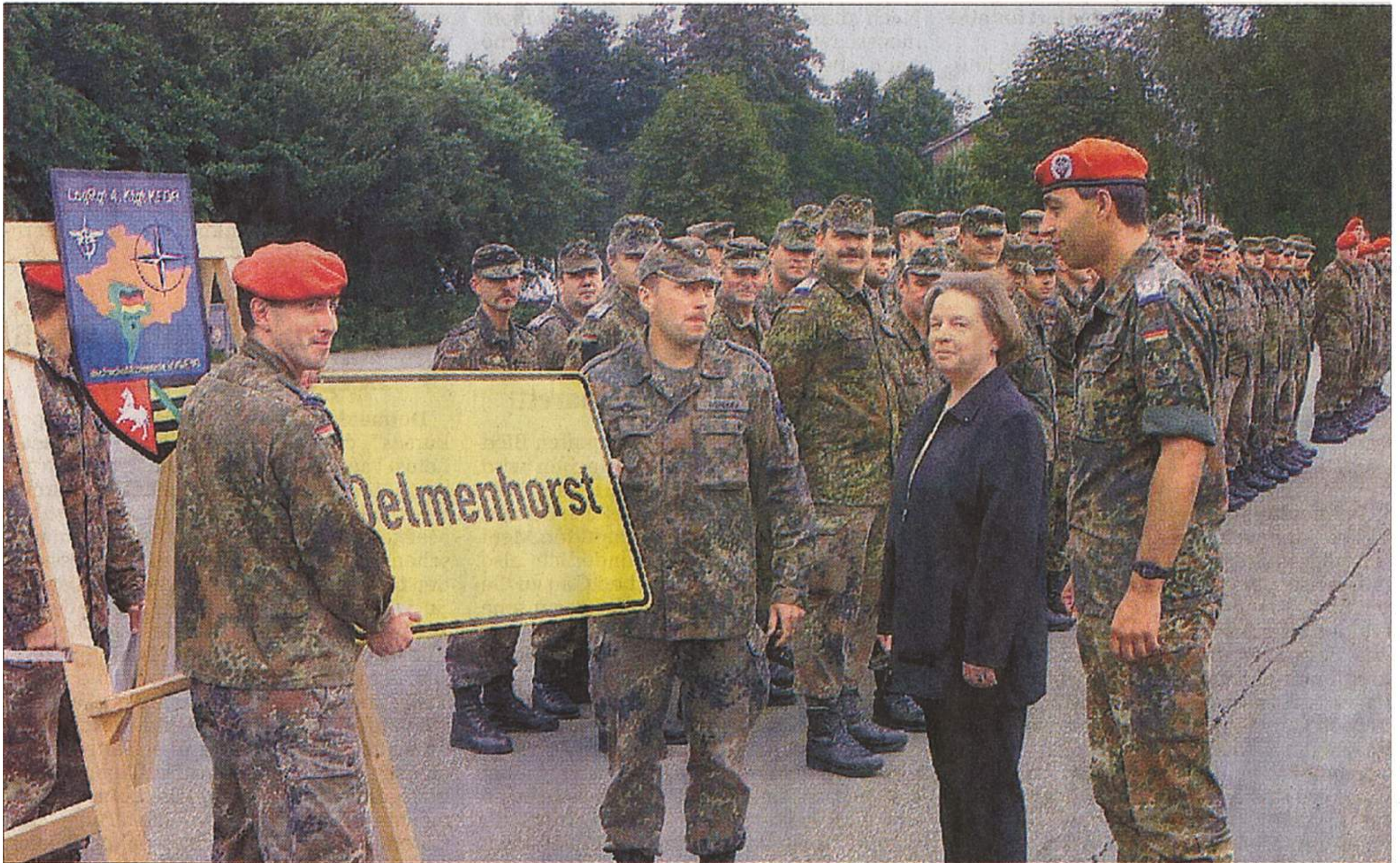
Zurück in der Barbara-Kaserne in Adelheide ist nun auch das Ortsschild, das das vierte Einsatzkontingent der KFOR während ihres Kosovo-Aufenthalts an die Heimat erinnern sollte. gj/Foto: Möllers