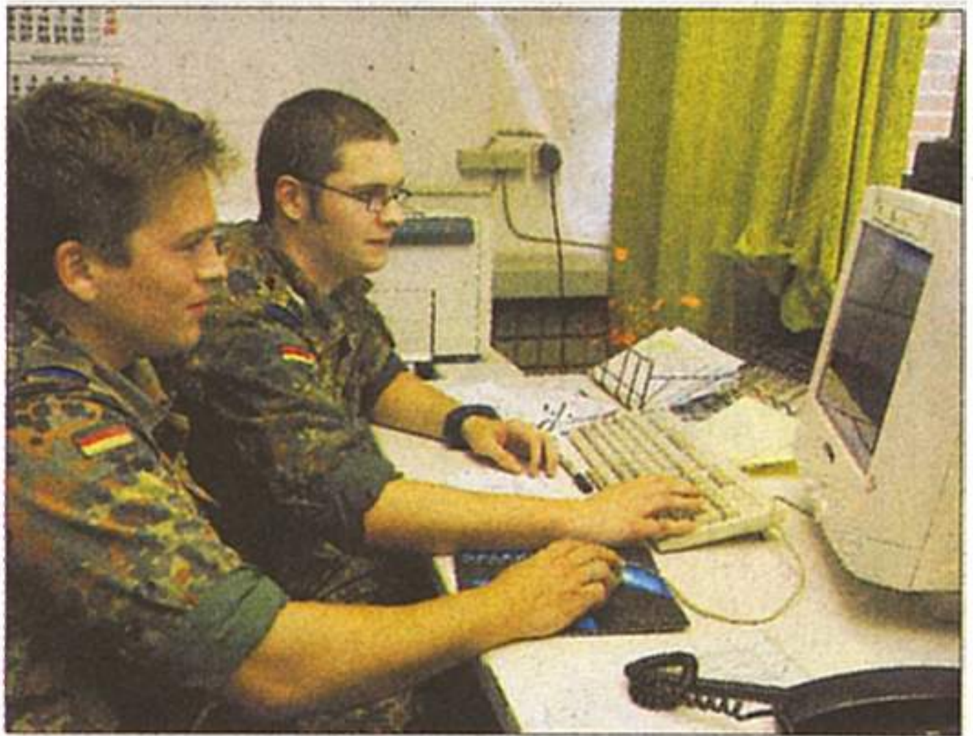
Moderner Arbeitsplatz Bundeswehr: Soldaten bei der Datenerfassung.

weise Unteroffiziere für folgende Tätigkeiten: S-1-Personalabteilung (führt Übersichten, Tabellen, Statistiken und Personalunterlagen am PC), Materialnachweis (prüft Materialanforderungen und wirkt an deren Beschaffung mit),